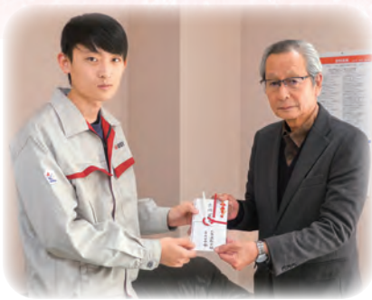
大島造船所労働組合からの寄付

(有)スーパーながむら (医) たいら医院 (有)高山商店 (株)中村産業 (有)日本郵便 (株)七釜郵便局 (有)馬場産業 (福)ふるさと (福)特別養護老人ホームふるさと (福)グループホームふるさと (福)第2グループホームふるさと 堀川自動車 未 来施工株式会社 (有)山田建設 (有)やまでん ヤマギシズム生活西海実蹟地 農事組合法人 (有)山崎 マーク (株)よかところ 日本郵便(株)横瀬郵便局 (有)レインボーサービス 西海北小学校 西海東小 学校 西海小学校 西海 中学校 Aコープ横瀬店 (福)ふるさとシニアライフ サポートセンター 西海 地区民生委員児童委員協