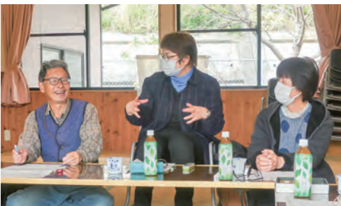
活発な意見が飛び交う連絡会

参加者は「この地域も人が減り少し寂しさは感じるが、元気なうちは可能な限り地域の見守りを続けていきたい」と、にこやかに話してくれました。