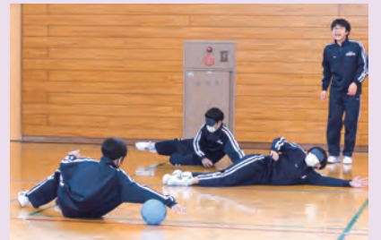
ゴールボールで体を大きく床に伸ばす生徒達