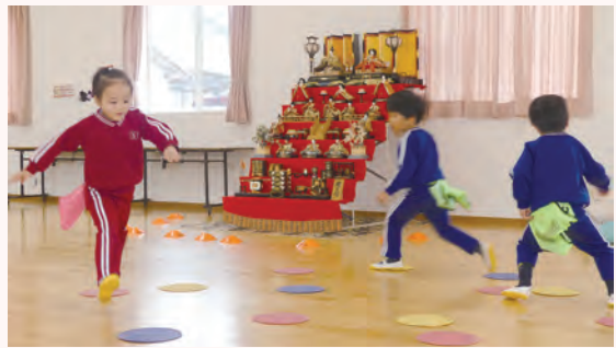
体育教室でミニゲームを行う園児達