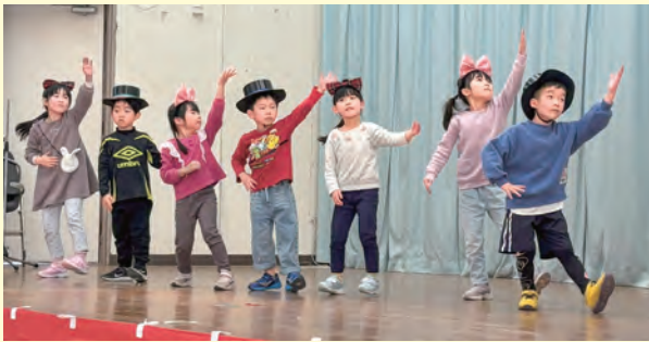
元気なダンスを披露した園児たち

社協職員による寸劇も好評で「また行事が開催されれば参加したい」という声が多く聞かれ、地域の絆を深める集いとなりました。