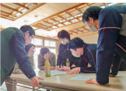
地域マップを用いて話し合いを行う参加者

参加者は「住民も活動する人間も減少してきているが、出来る限り地域を支えていきたい」と話しました。