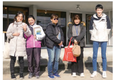
3日間おつかれさまでした

体験を終えた参加者からは「今回イベントが開催されると聞き思い切つて参加してみた。西海市の魅力も堪能し、身体に障がいがある方が入所する施設の見学、デジタル技術やロボットなどを取り入れた最新の施設を見学できて良かった。移住の事も含め、これから働きたい」という声が聞かれました。