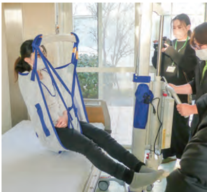
電動介護リフトを体験

「エクスカーション」は短期間の旅行を意味し、今回の事業は西海市の地域体験と福祉の仕事を組み合わせた人材確保に向けた取り組みです。