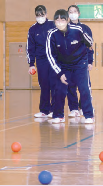
今注目のparasports「ボッチャ」

赤と青の2チームに分かれ、目標球と呼ばれる白いボールを指して赤と青のボールを投げ、どれだけ近