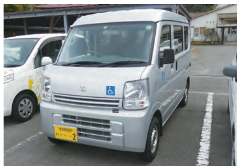
車いす対応軽自動車