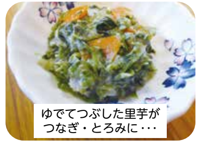
ゆでてつぶした里芋が つなぎ・とろみに...

美味しく食べることは、元気に過ごすことにつながります。介護食に便利な商品もあるので、それに合った市販品を上手に取り入れることも、にぎりやすい箸やスプーン、滑り止めや、すくいやすく作られたお皿等の食器もあります。