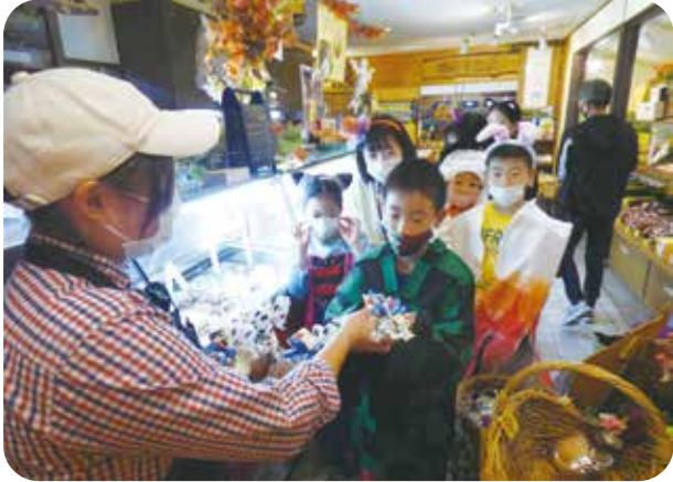
お菓子をもらう児童たち