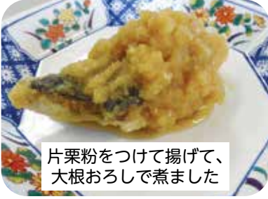
片栗粉をつけて揚げて、大根おろしで煮ました