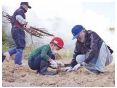
イモを傷つけないように注意

平成元年から続けてきた「ふれあい農園」、崎戸小児童のために地元のボランティアが畑を管理してきました。今年度いっぱい閉校する崎戸小学校